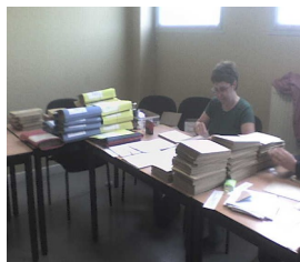
La mise sous enveloppe. 6 h de travail ! 10 personnes bénévoles mobilisées, pour se relayer!