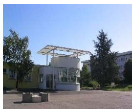
L'entrée du lycée Arthur VAROQUAUX