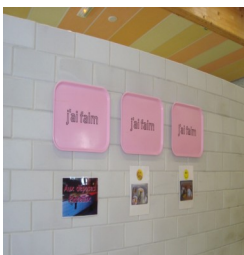
Quand les plateaux s'affichent

Evoquée en 1999/2000, la construction de la nouvelle restauration scolaire, commune à 3 établissements, et dotée d'une enveloppe de 7.5 M d'€. 2078 élèves y sont inscrits.